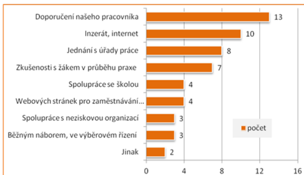
Obrázek 5.1: Jakým způsobem byli přijímáni absolventi se ZP ve Vaší organizaci? (údaje v počtu přijatých absolventů se ZP) 27

Shrneme-li výsledky šetření v této oblasti, pak (podobně jako u běžné populace) jsou pro úspěšný vstup absolventů se ZP na trh práce velmi důležité osobní kontakty, a to jak založené na přímém doporučení pracovníka, tak i získané v průběhu praxe. U doporučení pracovníka hraje pozitivní roli i určitá záruka a reference, které pracovník poskytuje. Kontakty navázané v průběhu odborné praxe jsou výhodné pro obě strany, žáka i zaměstnavatele. Zaměstnavatel má v průběhu praxe příležitost si pracovní výkon a schopnosti žáka otestovat. V případě žáků se ZP je právě tento přímý kontakt významný v tom, že může pomoci odstranit určité předsudky nebo obavy potenciálního zaměstnavatele a podpořit rozhodnutí absolventa zaměstnat. Pokud se tedy školám (případně rodičům) podaří zajistit pro žáky se ZP vhodnou praxi, která odpovídá jejich možnostem, může to jejich vstup na trh práce usnadnit. Na druhou stranu, je třeba uvést, že pro školy je zajištění odpovídající praxe často složité, zejména pokud škola vyučuje obory, ve kterých se soustřeďují žáci s určitým druhem postižením z celé republiky.